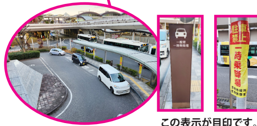
この表示が目印です。