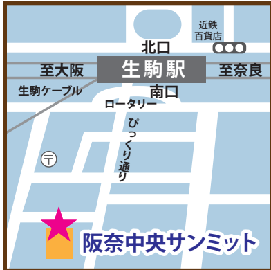
阪奈中央サンミット TEL 0743-85-5526